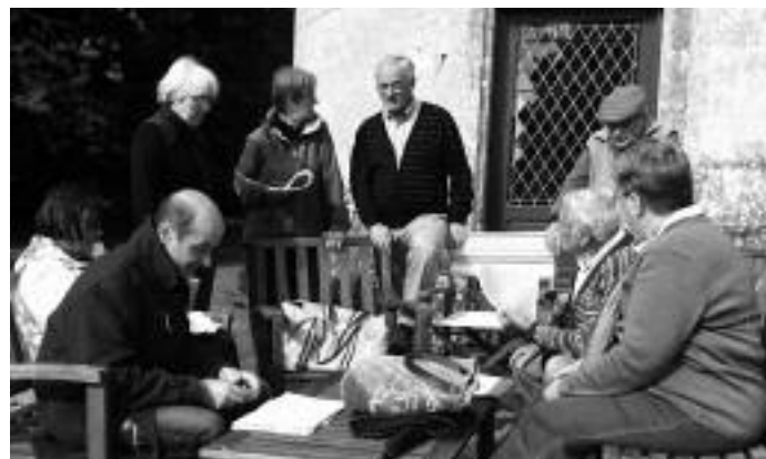
Répétition des lecteurs.