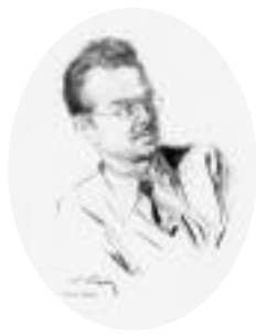
La lettre de Thias

Notre assemblée générale est donc levée à 12 h 30.